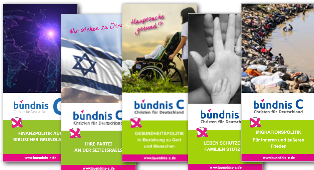
Minibroschüren zu Finanzpolitik, Israel, Gesundheitspolitik, Familie und Lebensschutz, Außenpolitik und Migration