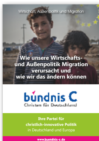
Wirtschaft, Außenpolitik und Migration: Wie unsere Wirtschafts- und Außenpolitik Migration verursacht und wie wir das ändern können (A5-Broschüre)