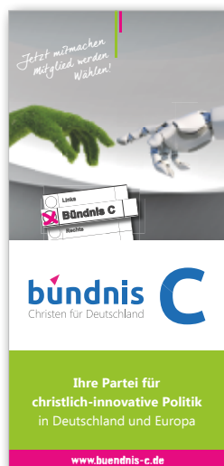
Erstinfo-Flyer: Unser Mini-Handzettel liefert einen Schnellüberblick über das Positionsspektrum von Bündnis C.