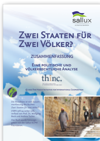
Zwei Staaten für zwei Völker? Warum die Zwei-Staaten-Lösung für Israel und Palästina gescheitert ist und realistische Wege zum Frieden (A5-Broschüre)