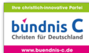
Autoaufkleber, 20 x 12 cm