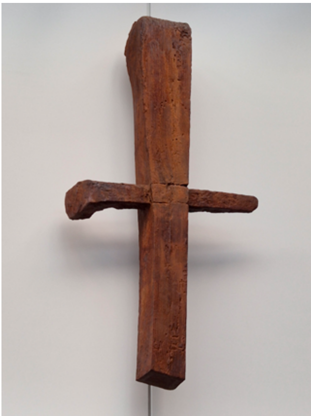
Kreuz im Sitzungssaal der CDU/CSU-Fraktion

Angesichts der multiplen Krisen in Europa und weltweit war das Leitmotiv Anstoß für mehrere Redner, zu erklären, was aus unserer christlichen Perspektive ein gutes, erfülltes Leben ist, für das Politiker arbeiten, und wovon sie sich darin leiten lassen sollten. Über materiellen Wohlstand hinaus brauchen unsere Gesellschaften Freude, Hoffnung, Kraft und Gemeinschaft, und sogar die Gewissheit auf ein zukünftiges Leben, wo bisherige Sicherheiten und Wohlstand jetzt in Frage stehen. In diesem Geiste war die Gemeinschaft der Tage in Berlin geprägt, zusammen mit maßgeblichen Politikern aus der deutschen Bundes- und Landespolitik und vielen internationalen Freunden und Verantwortungsträgern.