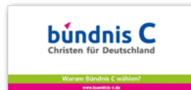
Schick, kurz und bündig: Unser Treppenfalt-Blatt „Warum Bündnis C wählen?“

Telefonisch oder per Email bestellen bei: