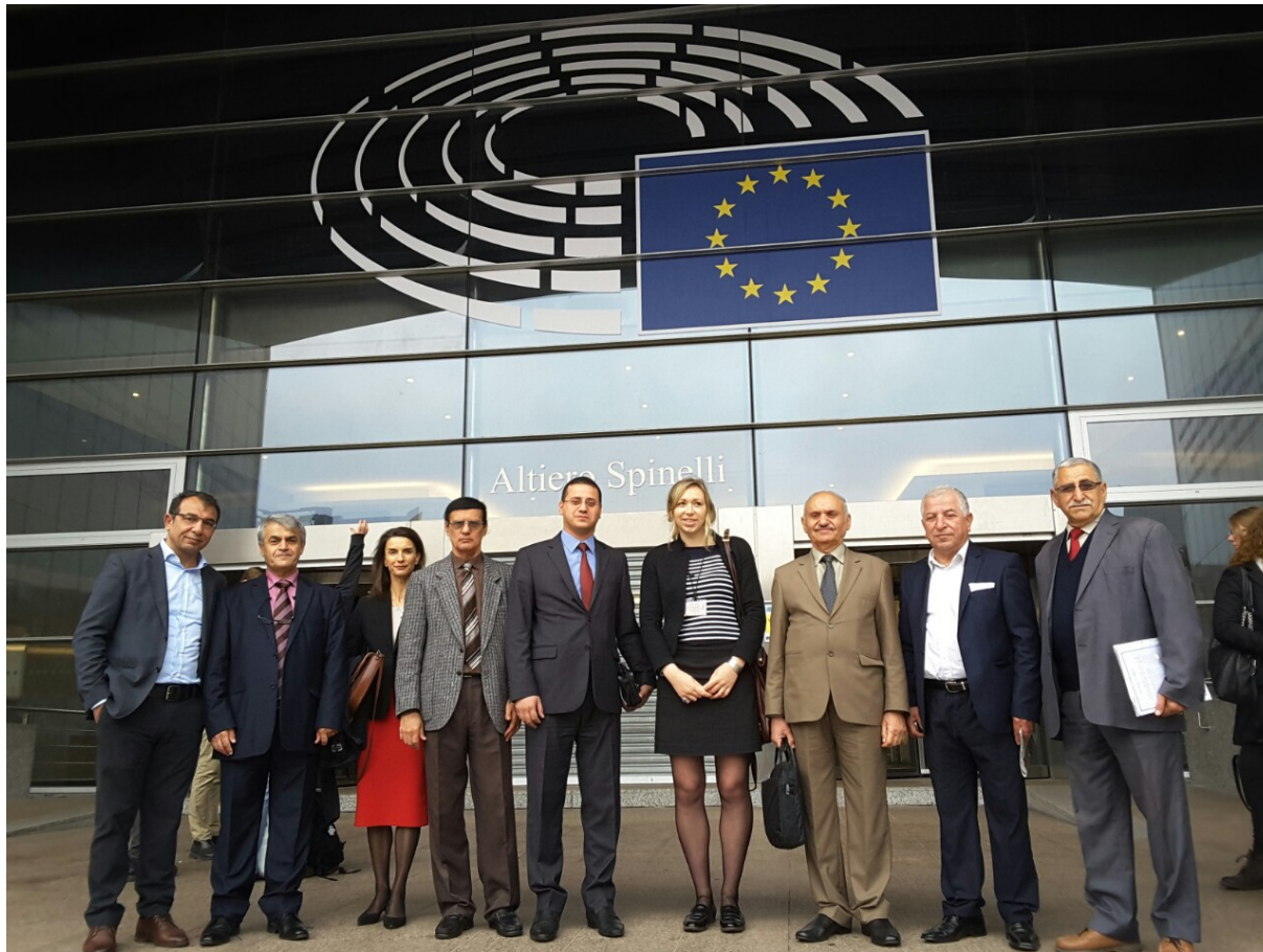
30.09.2016 Konferenz mit irakischen Politikern im EU-Parlament